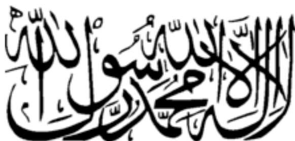
La professió de fe cal·ligrafiada en àrab

* l'afirmació de que Déu és U, i que va inspirar Muhàmmad. En àrab es diu: Ashhadu anna la ilaha il-la Al-lah wa anna Muhammad rasul Al-lah . Aquestes paraules són la professió de la fe musulmana.